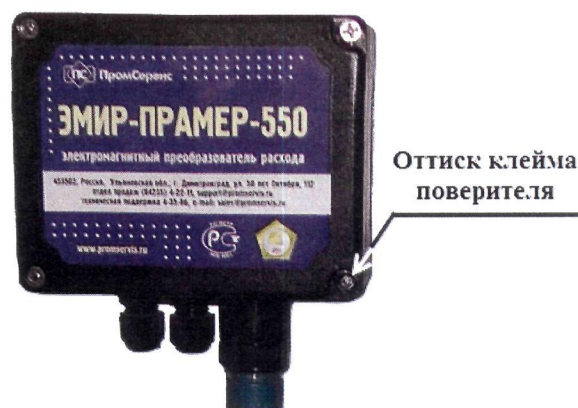
Рисунок 4 – Место пломбирования ЭП в пластиковом корпусе