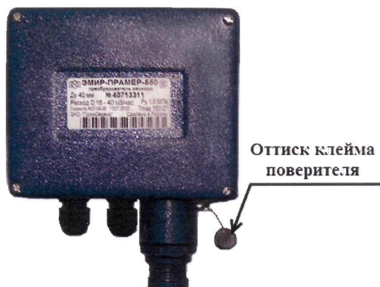
Рисунок 3 – Место пломбирования ЭП в стальном корпусе

В целях предотвращения несанкционированного доступа к узлам регулировки, настройки и программному обеспечению, а также элементам конструкции предусмотрены места пломбирования, указанные на рисунках 3 и 4.