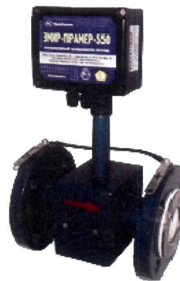
Рисунок 2 – Внешний вид преобразователей с ЭП в пластиковом корпусе

Программное обеспечение преобразователей является встроенным. Всё программное обеспечение преобразователей является метрологически значимым. Для применения внешнего ПО реализован стандартный протокол обмена Modbus.rtu. Для подключения преобразователя к персональному компьютеру применяется преобразователь интерфейсов TTL/RS-485.