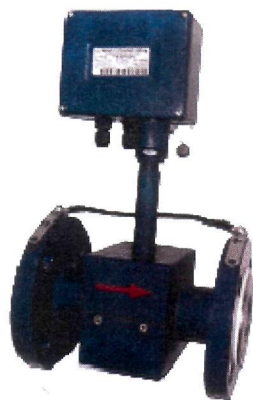
Рисунок 1 – Внешний вид преобразователей с ЭП в стальном корпусе